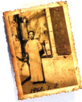
共匪？漢奸？台獨？一個記錄時代的真實傳奇。